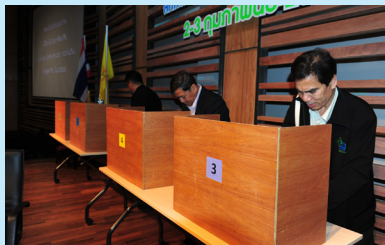
บรรยากาศเลือกตั้ง