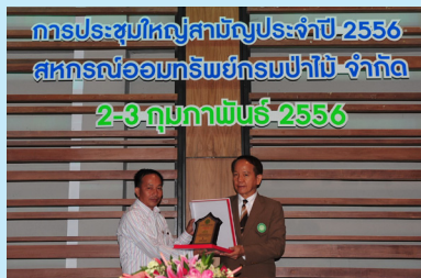
การประชุมใหญ่สามัญประจำปี 2556 สหกรณ์ออมทรัพย์กรมป่าไม้ จำกัด 2-3 กุมภาพันธ์ 2556