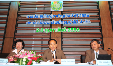
ประธานกรรมการดำเนินการ เลขานุการและผู้จัดการดำเนินการประชุม

วันที่ 2-3 กุมภาพันธ์ 2556 สหกรณ์ออมทรัพย์กรมป่าไม้ จำกัด จัดการประชุมใหญ่สามัญประจำปี 2556 โดยมีผู้แทนสมาชิกจำนวน 286 คน จากทุกจังหวัดทั่วประเทศ เข้าร่วมประชุมเพื่อพิจารณาผลการจัดสรรกำไรสุทธิ การเลือกผู้สอบบัญชี และผู้ตรวจสอบกิจการ การพิจารณาแผนงานและงบประมาณประจำปี 2556 และสรรหากรรมการดำเนินการเพื่อทดแทนกรรมการชุดเดิมซึ่งหมดวาระ จำนวน 8 ท่าน พร้อมทั้งจับรางวัลออมทรัพย์ชีวิตพอเพียง โดยมีผู้แทนสมาชิกได้ร่วมแสดงความคิดเห็นและอภิปรายในแง่มุมต่าง ๆ เพื่อให้คณะกรรมการดำเนินการชุดใหม่ นำไปพิจารณาเพื่อพัฒนาสหกรณ์ให้เจริญก้าวหน้าและก่อประโยชน์ต่อมวลสมาชิกอย่างสูงสุด