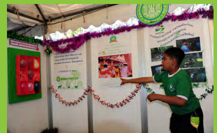
เล่นเกมกันอย่างสนุกสนาน