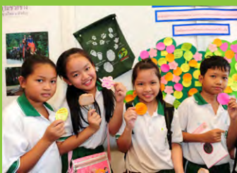
หนูร่วมเขียนปณิธานด้วยคนละ