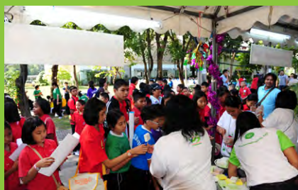
เข้าแถวกันก่อนนะจ๊ะ ได้รับไอติมกันทุกคนจ้า...