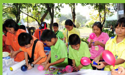
เอาใครจะแตกก่อนกัน รับรางวัลไปได้เลย..