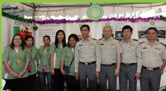
ถ่ายรูปหมู่ร่วมกันเป็นที่ระลึก