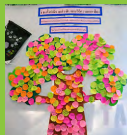
ต้นไม้รวมดวงใจ